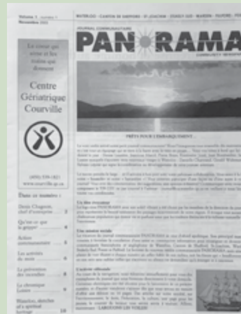
Le premier numéro de PANORAMA, paru en novembre 2003.

Un bel avenir se prépare donc pour PANORAMA, qui contribue à la cohésion de la communauté et au sentiment d'appartenance des citoyens. Soyons fiers de notre journal communautaire. Renouvelons notre membership (il faut le faire à chaque année) et participons en grand nombre à la levée de fonds 2025!